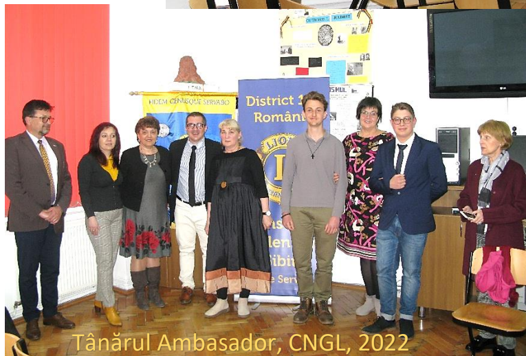
Tânărul Ambasador, CNGL, 2022